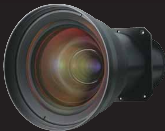
独自開発HD高精細レンズ

(組織体を構成する会社／(株)NHKエンタープライズ・(株)ジャンプコーポレーション・(株)ざらい)