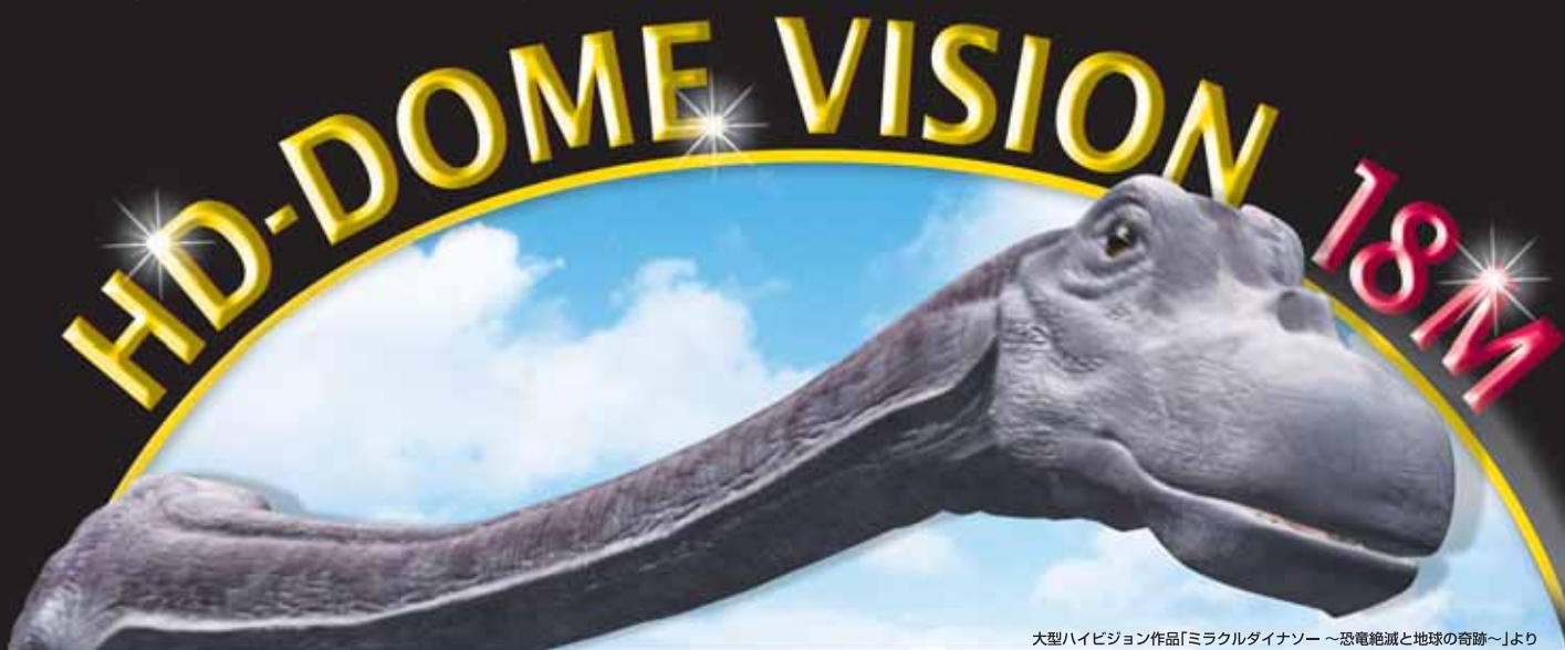
大型ハイビジョン作品「ミラクルダイナソー ～恐竜絶滅と地球の奇跡～」より

ドームシアターに HD-DOME VISION 投影機器を設置するだけで、ドームスクリーンに横120度、縦67.5度の大型で高精細なフルハイビジョンシアターが誕生します。