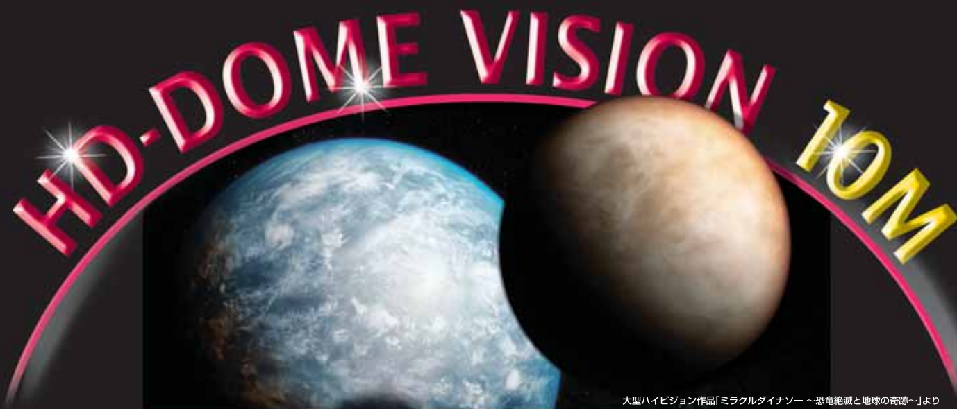
大型ハイビジョン作品「ミラクルダイナソー ～恐竜絶滅と地球の奇跡～」より

ドームシアターに HD-DOME VISION 投影機器を設置するだけで、ドームスクリーンに横120度、縦67.5度の大型で高精細なフルハイビジョンシアターが誕生します。